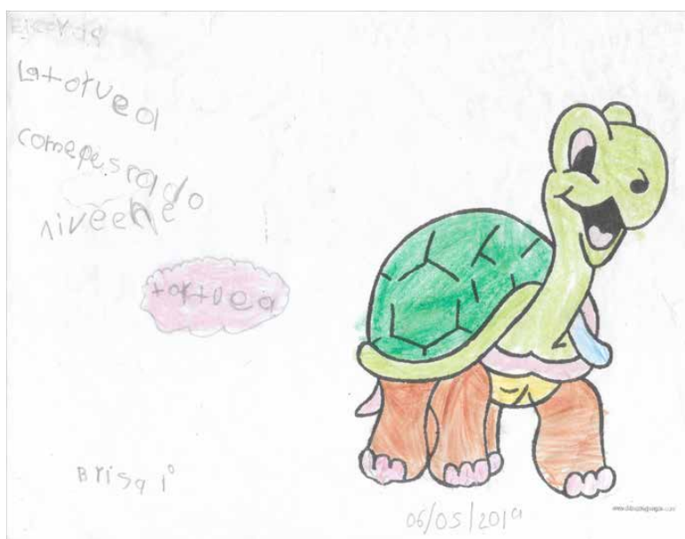
Imagen 2 – Escritura independiente de Brisa.

Entre los alumnos de 1°, Chris identificaba “problemas” como segmentación de palabras o el uso de mayúsculas. De Brisa y Fabián, decía que podían redactar autónomamente ideas acordes con el contenido de los textos; sin embargo, se les dificultaba ordenarlas “las escriben según se va acordando” – lo ejemplificaba con el texto que Brisa elaboró por sí sola el último mes del ciclo escolar (Imagen 2).