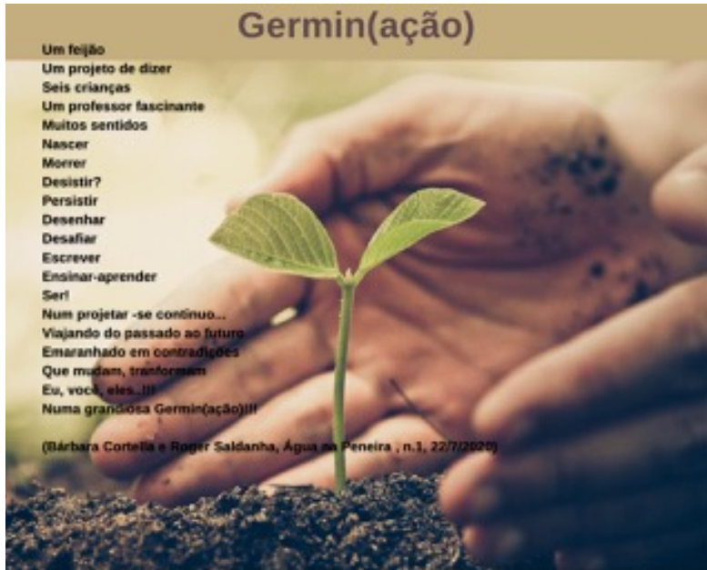
Imagem 1 – Poema Germin(ação) , de Bárbara Cortella e Roger Saldanha