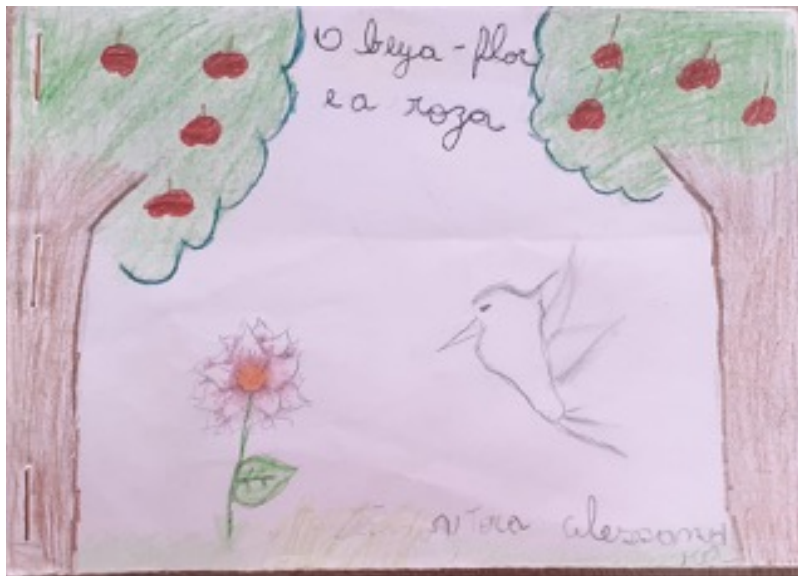
Imagem 3 – Capa do livro da criança-aluno Beija-flor