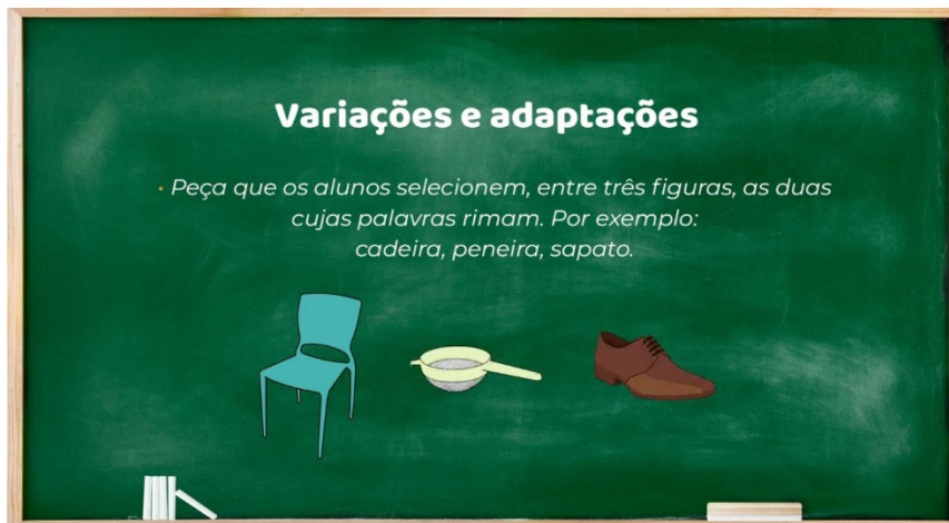
Imagem 1: Variações e adaptações para o trabalho com rimas