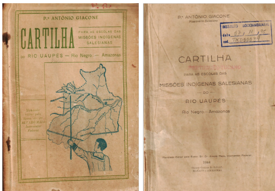
Figura 3 – Capa e contra capa da cartilha