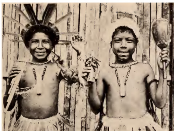
Figura 2 – Meninos indígenas estudantes das escolas salesianas.

Sobre o enaltecimento dos serviços salesianos prestados na Amazônia na primeira metade do século XX, destacamos duas delas que retratam crianças indígenas, em uma espécie de antes e depois: “[...] dois indiozinhos, ainda com os seus trajes selvagens, mal adivinham o que vão ser dahi a mezc [..]: escoteiros da terra abençoada do Brasil. Que transformação!”. (MISSIONÁRIOS SALESIANOS, 1933, p. 71). A comparação entre as fotos sugere que os objetivos civilizatórios estavam sendo alcançados.